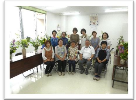
安養寺仏婦様 (6月21日)