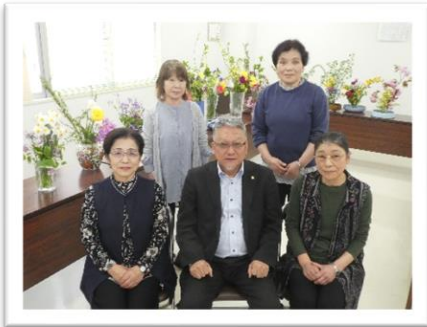
本立寺仏婦様 (4月19日)