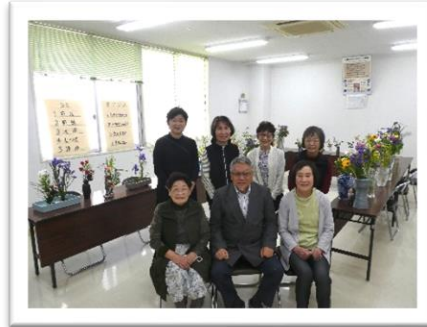
香源寺仏婦様 (5月17日)